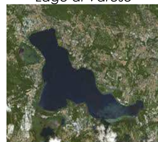
Lago di Varese

Azzate; Bardello; Biandronno; Bodio Lomnago; Buguggiate; Cazzago Brabbia; Galliate Lombardo; Gavirate; Varese.