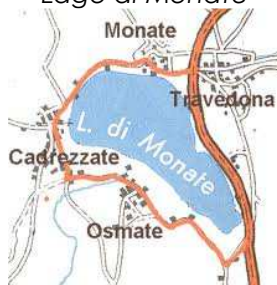
Lago di Monate

Cadrezzate; Comabbio; Osmate; Travedona Monate.