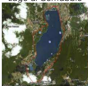
Lago di Comabbio

Comabbio; Mercallo; Ternate; Varano Borghi; Vergiate.