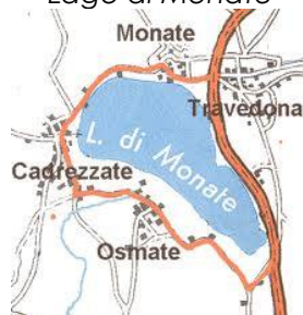
Lago di Monate

Cadrezzate con osmate; Comabbio; Travedona Monate.