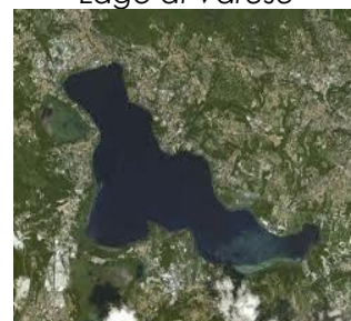
Lago di Varese

Azzate; Bardello; Biandronno; Bodio Lomnago; Buguggiate; Cazzago Brabbia; Galliate Lombardo; Gavirate; Varese.