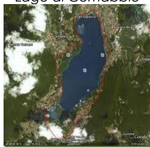
Lago di Comabbio

Comabbio; Mercallo; Ternate; Varano Borghi; Vergiate.